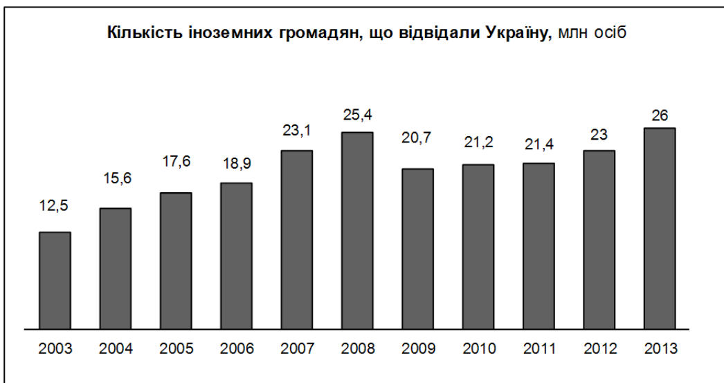
Рис. 1. Динаміка відвідування іноземних туристів в Україні за 10 років

Україна з року в рік приваблює все більше і більше туристів. За попередніми даними в 2013 році нашу країну відвідали понад 26 мільйонів гостей. На рис. 1 показано динаміку в'їзду іноземних туристів до України протягом десяти років [1].