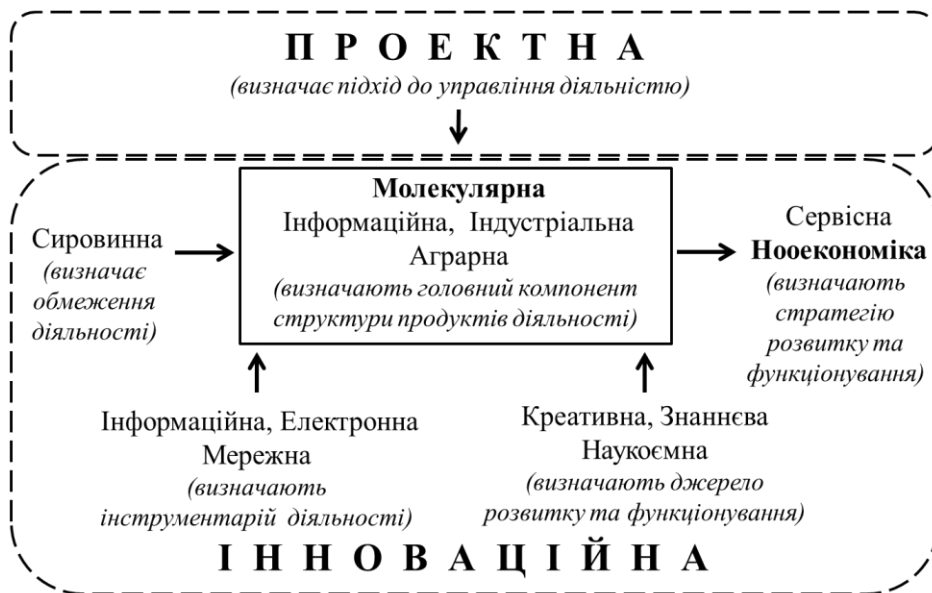
Рис. 4. Графічна форма представлення сучасної економіки як елементів процесної моделі