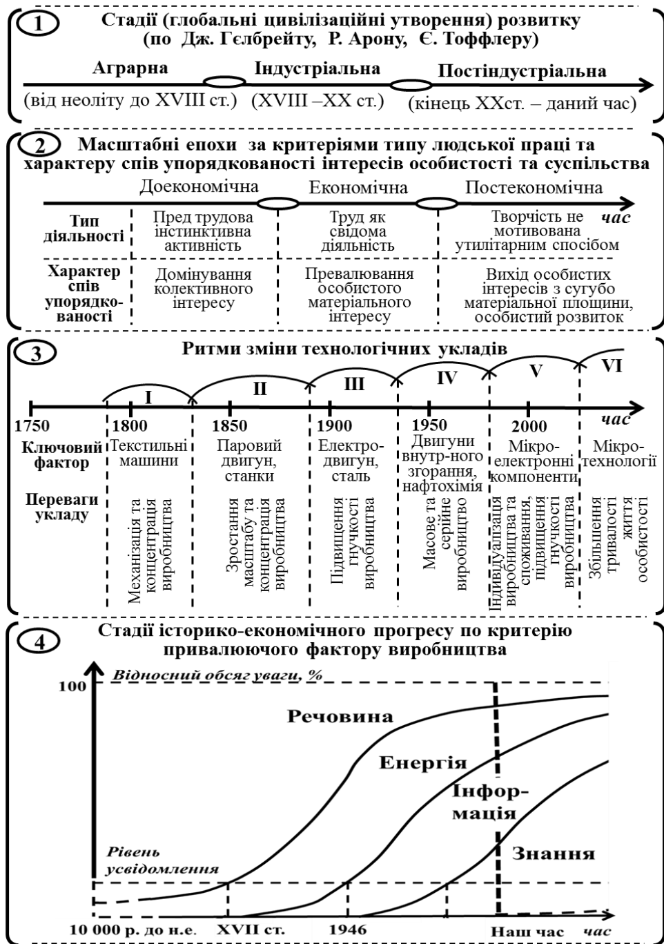
Рис. 2. Етапи (стадії) розвитку людства які класифіковані за різними критеріями (показниками)