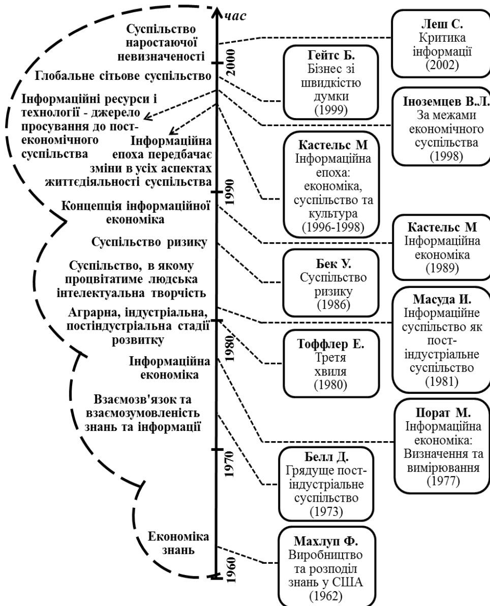
Рис. 3. Рух наукової думки від «Економіки знань» до «Суспільства наростаючої невизначеності»

надбанням одної особи. Знання можуть бути результатом отримання інформації [35]. Але, процес передачі знань, особливо новітніх технічних, є достатньо складним і несе відповідні загрози їх подальшому ефективному використанню.