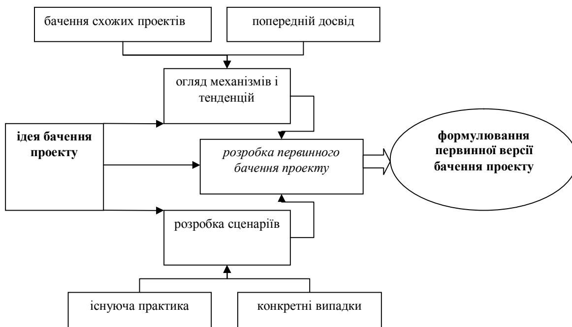
Рисунок 3. — Модель формування первинної версії бачення проекту

По друге, на основі досліджень різних існуючих механізмів і тенденцій, які дають змогу вплинути на середовище проекту, потрібно розробити первинну версію бачення проекту. Даний етап направлений на визначення основних елементів для складання опису бачення проекту. Також, розробити первинну версію бачення проекту, можливо через розгляд та підбір різних сценаріїв, що дозволяє покращити розуміння бажаного результату, який має бути описано у баченні проекту рис.3.