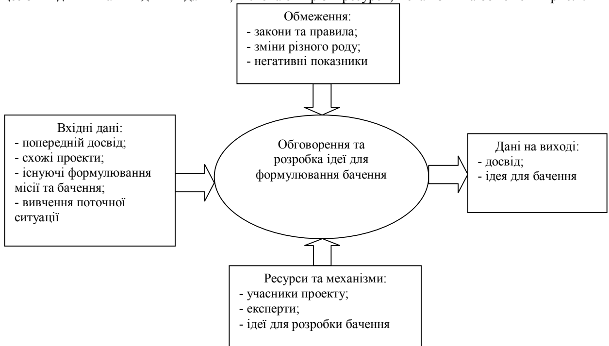
Рисунок 2. — Модель формування ідеї для розробки бачення проекту

Розглянемо системний підхід розробки бачення проекту, який складається з різних етапів. Перш за все потрібно сформулювати ідею для розробки бачення проекту, даний крок змодельований як процес зі входними та вихідними даними, включаючи різні ресурси, механізми та обмеження рис.2.