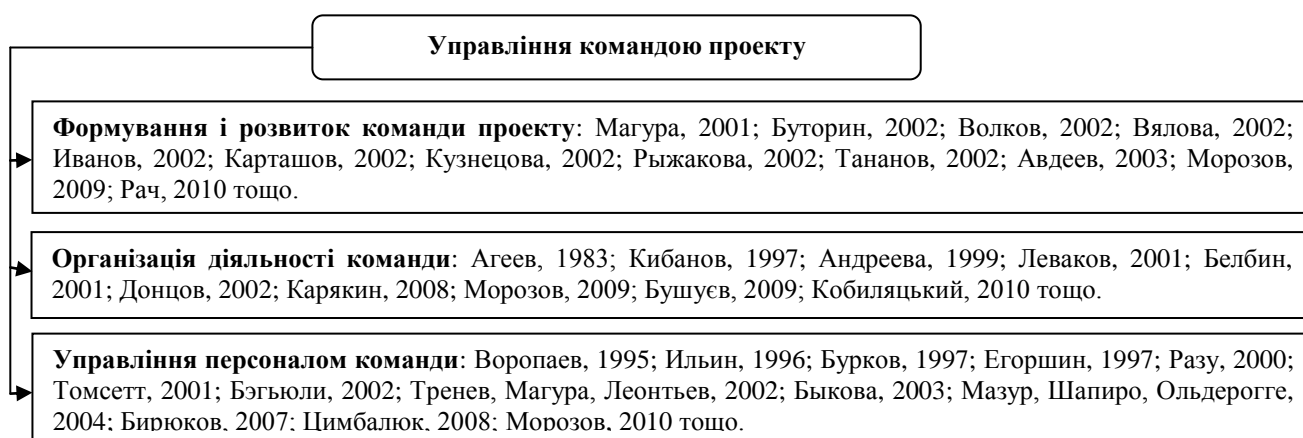
Рисунок 2 – Управління людськими ресурсами в дослідженнях вітчизняних та зарубіжних вчених

Виділення невирішених раніше частин загальної проблеми, котрим присвячується означена стаття. Авторський нагляд та узагальнення вжитих заходів щодо вдосконалення пасажирських перевезень у м. Івано-Франківськ (грудень, 2001р.), м. Чернігів (квітень, 2003р.), м. Сімферополь (квітень, 2004р.), м. Львів (березень, 2005р.), м. Київ (грудень, 2005р.), м. Конотоп (жовтень, 2007р.), м. Маріуполь (квітень, 2008р.), м. Кременчук (жовтень, 2008р.) виявили залежність ефективності формування та управління попитом на перевезення у міському сполученні від стандартів управління трудовими ресурсами проектів та методів формування команди проектів та програм розвитку міських пасажирських перевезень. Невирішеність зазначених проблем є підставою для даного дослідження, визначення мети і завдань та свідченням їх актуальності.