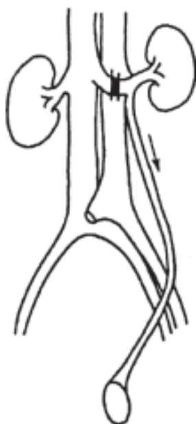
Рис. 1. Перший гемодинамічний тип за Coolsaet

Ультразвукове дослідження проводили у ортостазі та кліностазі, використовуючи пальцеву пробу Flaty та Вальсальве [1]. Пробу Flaty проводили у ортостазі, датчик встановлювали