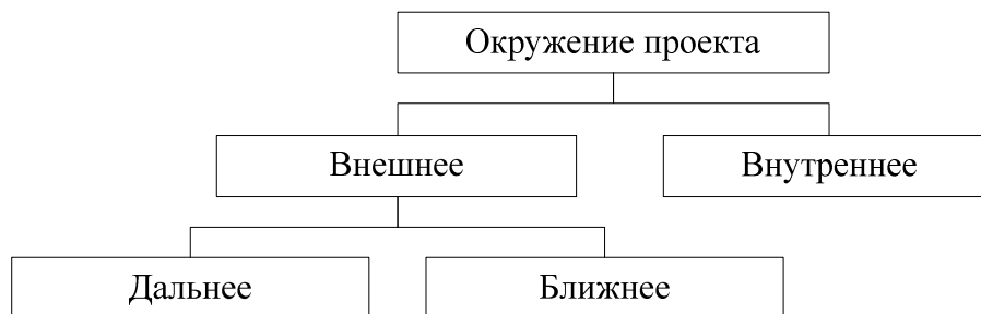
Рис.1. Элементы конфигурации окружения проекта

Проанализируем результат процессов интеграции проекта с точки зрения различных видов его окружения. Согласно [13], выделяют следующие виды окружения проекта.