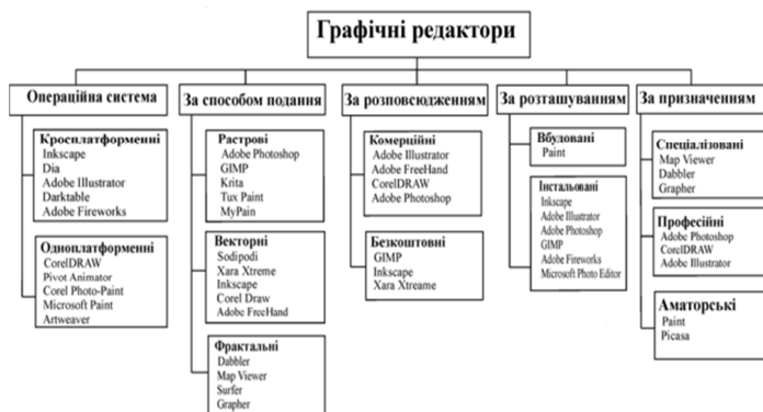
Рисунок 1 – Класифікація графічних програмних засобів

До класифікаційних ознак програмного забезпечення, окрім способу подання інформації, слід долучити ознаки призначення, умови розповсюдження, підтримувані операційні середовища, тип розташування. Повний вигляд пропонованої класифікації наведено на рис. 1. Класифікація не є остаточною, але дозволяє користувачу орієнтуватися в головних розробках, що є популярними на сьогодні.