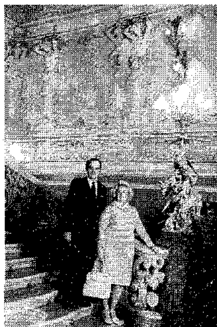
Одеса. Оперний театр

Для повноцінного ведення навчального процесу була суттєво покращена матеріальна база кафедри. З 1980 року зусиллями колективу кафедри стоматології дитячого віку, адміністрації ме-