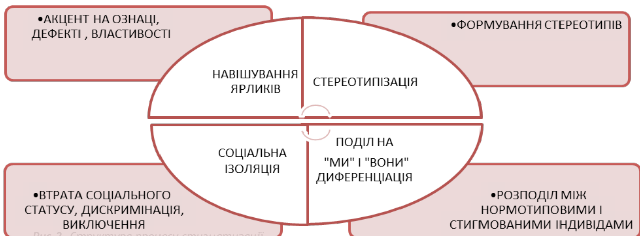
Рис.2. Структура процесу стигматизації

У роботах частини дослідників стигматизацію представлено як комплексний механізм. Наразі Б. Майджор та Л. О'Брайен [30] розглядають її не як окремий процес виокремлення певних ознак чи соціального тиску, а як взаємодію різних соціальних процесів (рис. 2). І саме така інтегративна модель, на нашу думку, найбільше відповідає як сучасному розумінню стигми, так і ролі соціальних працівників у її протидії.