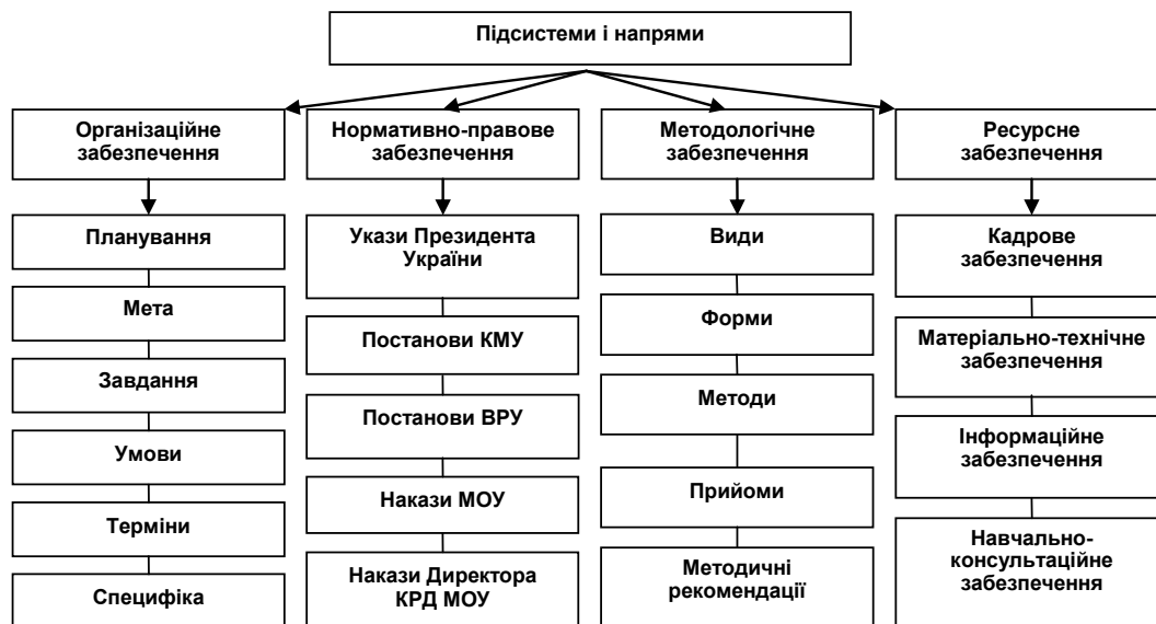
Рис. 2. Підсистеми і напрями координаційної системи забезпечення фінансового контролю у Збройних Силах України

но-ревізійних служб, автоматизація збирання, зберігання і поновлення інформації, підвищення продуктивності праці фінансових і контрольно-ревізійних працівників.