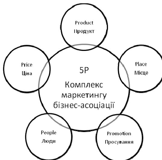
Рис. 4. Комплекс маркетингу бізнес-асоціації