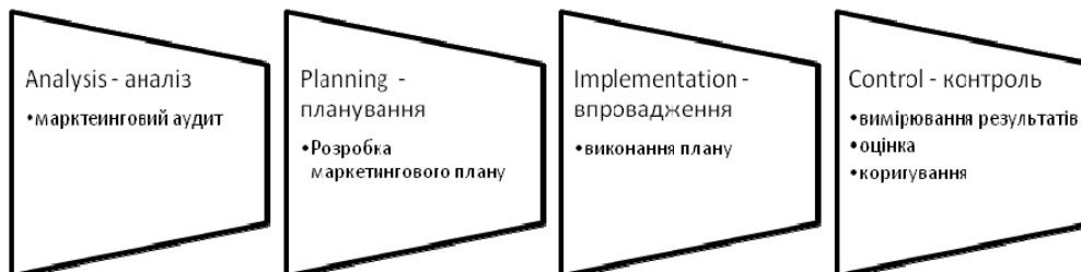
Рис. 3. Маркетингова діяльність. Підхід APIC

Таке визначення дає змогу виявити, що бізнес-асоціації можуть ефективно застосовувати різні маркетингові техніки для систематизації своєї діяльності, зокрема маркетингове планування, маркетинговий аудит, розробка маркетингової стратегії, контролю та оцінки маркетингової діяльності. Котлер пропонує розглядати управлінську діяльність за підходом APIC (аналіз, планування, впровадження, контроль) [6]. Діяльність бізнес-асоціації може бути розглянута з точки зору такого підходу (рис.2).