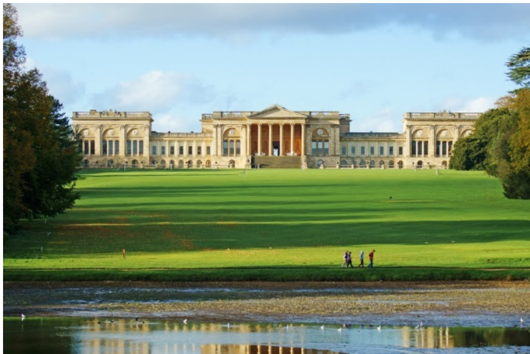
Рис. 5. Організація садового простору біля палацу у англійському саду Стоу (Stowe), Англія, закладеному у 1853 році

З вищенаведеного видно, що у архітектора В.І. Беретті у руках були всі складові, необхідні для розбивки палацової частини справжнього англійського саду – і величний палац у класичному стилі, і його розташування на верхній точці університетської гірки, і схил від палацу вниз на відстань, достатню для того, щоб створити луговий простір, який відповідав би монументальності архітектури головного будинку університету.