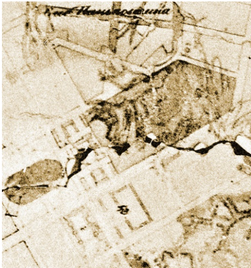
Рис. 4. Фрагмент генерального плану Києва з територією Університету станом на кінець 1838 року [8]

зведення ботаничного саду належить к распоряженію Совета Университета Св. Владимира" [7, с. 1], а Будівельний комітет повинен був опікуватися будівництвом оранжерей, огорож і т.ін.