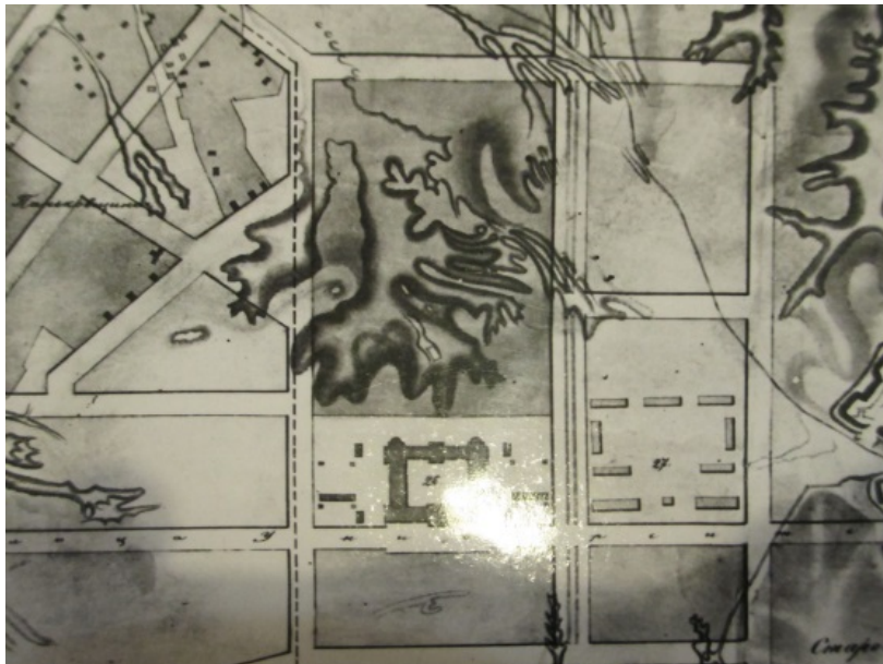
Рис. 2. Фрагмент генерального плану Києва з територією Університету станом на 1836 рік [17]

Цікаво, що на той час ця земля вже була приєднана до території Університету (див. рис. 2).