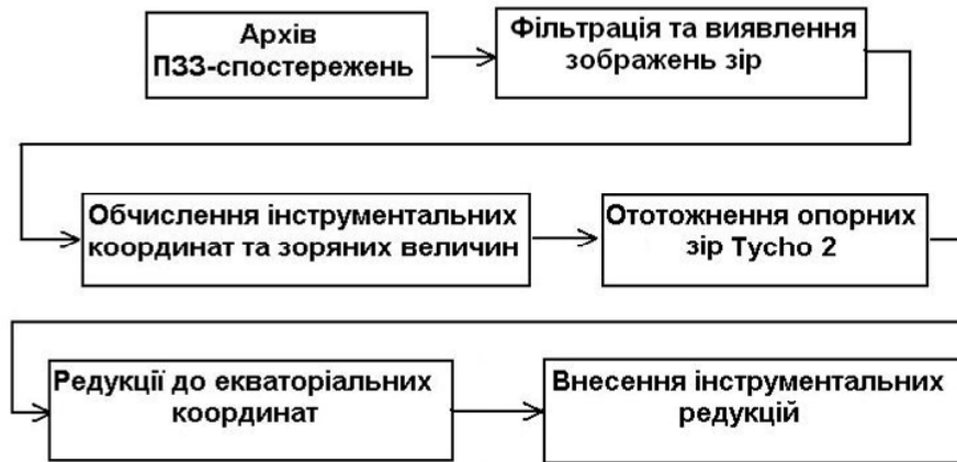
Рис. 1. Етапи компіляції попереднього ПЗЗ-каталогу