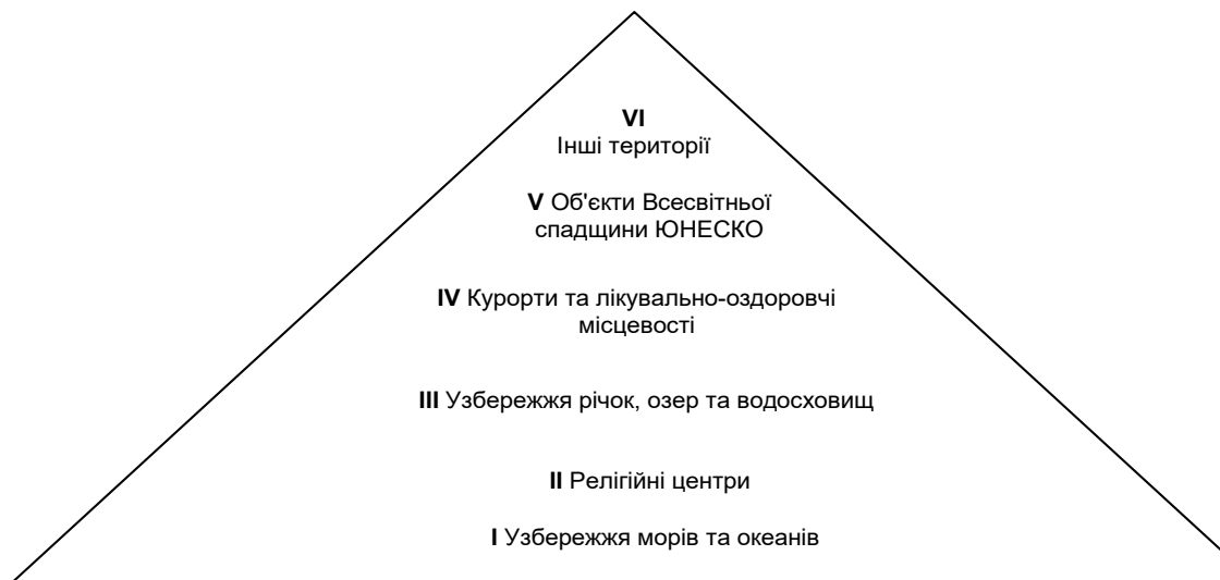
Рис. 1. Ієрархія фундаментальних світових рекреаційно-туристських ресурсів

Виклад основного матеріалу. За обсягами надходжень міжнародний туристський рух посідає одне із провідних місць у світі. Напрями туристських потоків у першу чергу спрямовуються до найцінніших у природному та історичному плані територій, серед яких виділяються об'єкти Всесвітньої спадщини ЮНЕСКО. Уявлення про принципову структуру рекреаційно-туристських ресурсів дає рис. 1.