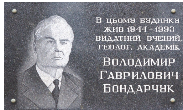
Рис. 6. Фото меморіальної дошки Києві, на вулиці Льва Толстого, 13, де з 1944 по 1993 рік жив В.Г. Бондарчук

Таким чином, наукові ідеї великого вченого знайшли продовжувачів в Україні і поза її межами, а його багатогранна творча діяльність у багатьох напрямках геології зайняла почесне місце в українській та світовій геологічній науці. У Києві, на вулиці Льва Толстого, 13, де з 1944 по 1993 рік жив вчений, встановлено гранітну меморіальну дошку (рис. 6).