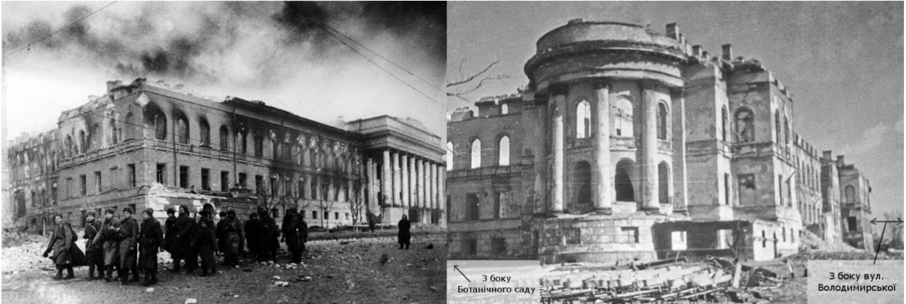
Рис. 2. Червоний корпус університету після визволення Києва від нацистських загарбників. Вид з пошкодженого південного крила будівлі з вул. Володимирської і частково Ботанічного саду, листопад 1943 р. [8]

університету (рис. 2-4) [5]. Проглянувши архівні фотографії, можна лише уявити, скільки зусиль необхідно було для реорганізації не лише будівель, але й наукового потенціалу університету. Забігаючи наперед, необхідно сказати, що це завдання Володимир Гаврилович виконав з честю. До 1950 року в університеті діяло вже 12 факультетів.