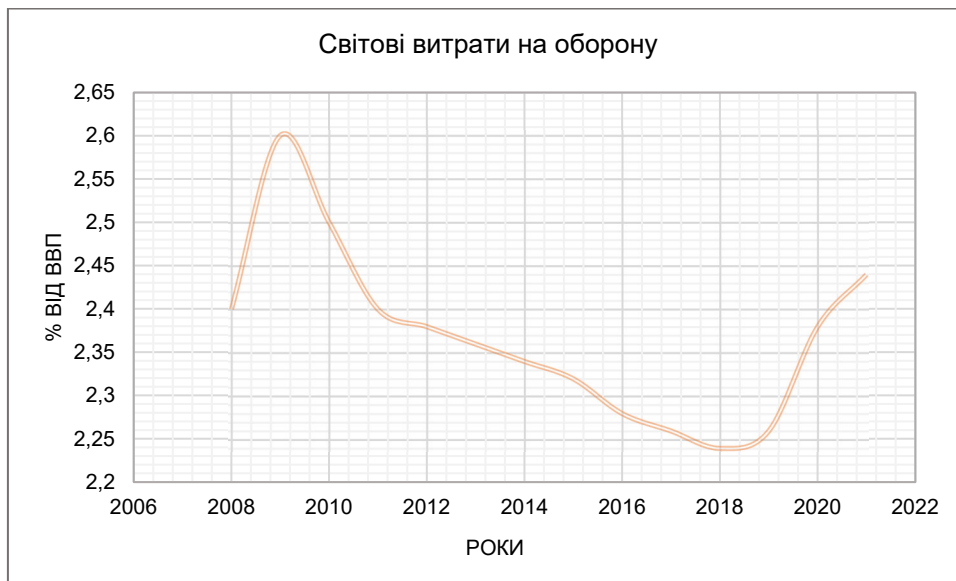
Рис. 1. Динаміка глобальних військових витрат за 2008–2021 роки (у %-му співвідношенні до ВВП)

Безсумнівно, оборонний бюджет держави – це детермінанта військової могутності країни. Видатки на оборону передбачають фінансування на утримання та розвиток збройних сил. Перебуваючи у стані війни, країна мусить вдосконалювати системи озброєння для підвищення ефективності протистояння ворогу, що, у свою чергу, підживлює попит на озброєння та нарощення витрат на національну безпеку та оборону. Для наочного розуміння та аналізу збройної агресії росії необхідно розглянути динаміку глобальних військових витрат. На рис. 1 наведено узагальнену динаміку світових військових витрат за 2008–2021 роки.