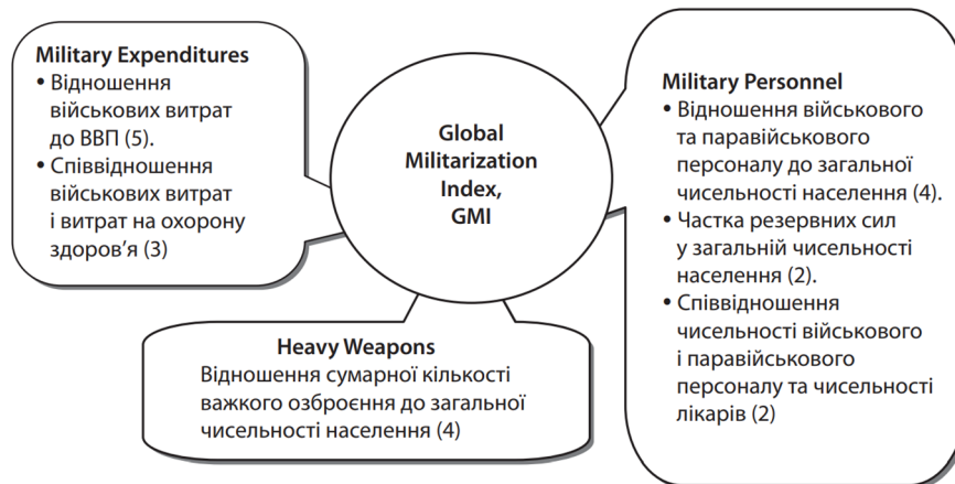
Рис. 3. Субіндекси та базові показники Global Militarization Index