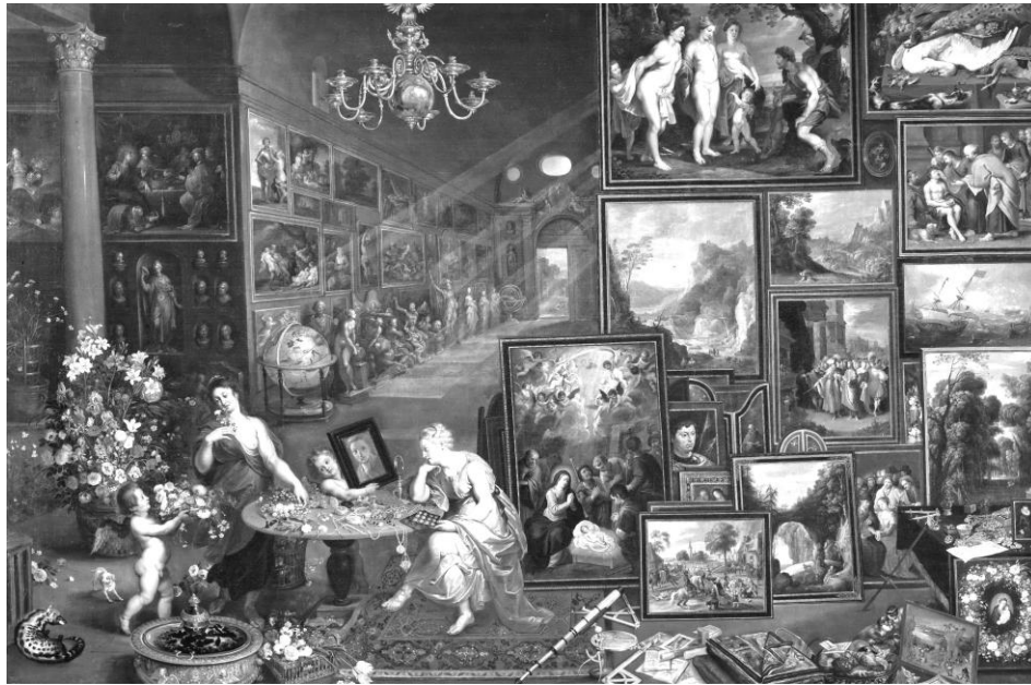
Брейгель Я. – «Аллегорія зрєння и обоняння»

М. Диакону в «Размышлении об эстетике осязания, обоняния и вкуса» обосновывает необходимость обратить пристальное внимание на неклассические формы чувствительности и особую роль среди них играет именно обоняние. «В то время как прикосновение кажется скромно прикрепленным к другим чувствам, в частности зрению и таким образом теряет свой специфический характер, парфюмерия не может быть сведена или даже приблизительно реконструирована с помощью любого другого искусства» [14]. Ж. Рансьер в интервью «Чувства и чувствительность» предлагает обратить внимание на то, что «события и формы искусств, которые создают чувственные формы умалчивают относительно друг друга» [16, с. 30]. Но если аудиальное говорит даже посредством тишины, а зрительное (и посредством него тактильное) за счёт тесной взаимосвязи зрительного восприятия и мыслительных процессов не оставляют попыток высказывания мысли как таковой, минуя собственно язык, то обонятельное даёт возможности передачи состояния как такового минуя саму мысль (по крайней мере – в её традиционном понимании), часто – с помощью других чувственных конструкций, как в случае одофона С. Пиесса.