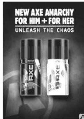
«Axe. Unleash The Chaos»

Юная девушка в буржуазной среде не должна иметь запаха, её «лёгкое дыхание» должно служить признаком её чистоты и неопытности как девичьего капитала. Она, по сути дела, не имеет тела и задача и привилегия мужчины – дать ей тело. Более того, её воображаемое также должно быть чистым от восприятий чужого опыта. Примером подобных представлений может служить известное мнение о том, что девушка, которая прочитала хотя бы несколько страниц «Ста двадцати дней Содом» Д. А. Ф. де Сада потеряна навсегда. «Тлетворный», ядовито-зловонный, мефитический дух, напротив, ассоциируется с опытом вплоть до присыщенности и, как следствие, извращённости.