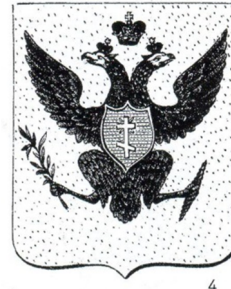
Герб Херсона, 1803 г.

Важными являются и религиозные медиаторы. Например, Херсонская епархия, основанная в 1837 г. и включавшая приходы Херсонской и Таврической губерний. Границы и названия кафедральных городов южно-украинских епархий неоднократно менялись как в царской России, так и в СССР, пока 11 февраля 1991 г. не была учреждена Херсонская епархия с кафедрой в Херсоне и титулом правящего архиерея «епископ Херсонский и Таврический». Епархия функционирует и по сей день, причем и в составе Украинской православной церкви (Московского патриархата), и в составе УПЦ-Киевского патриархата (с тем же архиерейским титулом). Учитывая, что титул правящего архиерея звучит в диптихе (списке упоминаемых имен) на каждой литургии, религиозный медиатор тоже играет свою роль в распространении топонима «Таврия» в Херсонской области. Структурной единицей Украинской автокефальной православной церкви выступает Таврийский деканат Харьковско-Полтавской епархии, окормляющий прихожан Николаевской, Херсонской и Кировоградской областей.