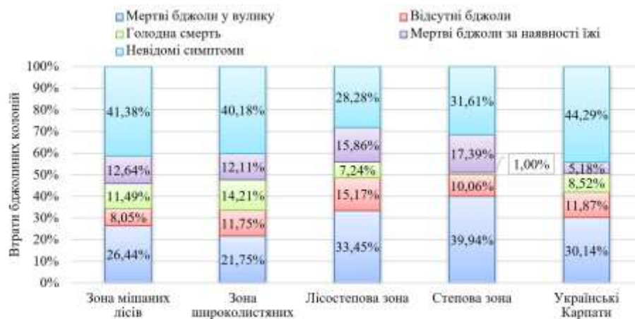
Рис. 4 – Ознаки загибелі бджолиних колоній після зимівлі 2018–2019 рр. за фізико-географічними зонами України