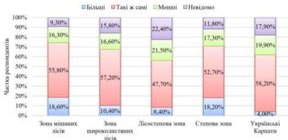
Рис. 5 – Оцінка респондентами ступеня проблем із матками після зимівлі 2019–2020 рр. порівняно з тими, що спостерігалися зазвичай за фізико-географічними зонами України