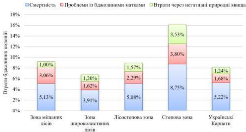
Рис. 3 – Основні показники втрат колоній A. mellifera після зимівлі 2019–2020 рр. в різних фізико-географічних зонах України