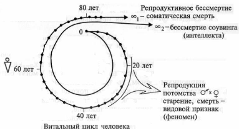
Рис. 2. Жизненный цикл человеческого индивидуума определяется программами П-1 (видовое бессмертие 1, связанное с воспроизводством поколений) и П-2 (социальное и интеллектуальное, творческое бессмертие 2, выраженное вкладом в становление цивилизации и культуры)

известные сегодня работы по конституциям В. И. Шапошниковой (Ленинград). Мы приводим эту схему индивидуального цикла. (Рис. 2).