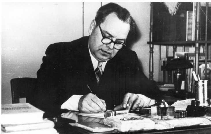
Рис. 1. Петр Иванович Зинченко.

ющуюся необходимым моментом собственного движения деятельности, ее развития», стал рассматривать память в контексте сложной человеческой деятельности, исследовать память в ее единстве с деятельностью. Одной из основных предпосылок деятельностного подхода к памяти выступает сформированное в русле функционально-генетического подхода представление о запоминании как сложном внутренне-опосредствованном процессе, являющемся результатом интериоризации внешних опосредствующих действий и состоящем из ряда различных, по преимуществу интеллектуальных операций. Такой «угол зрения» на память и составляет наиболее общий методологический принцип деятельностного подхода к ней.