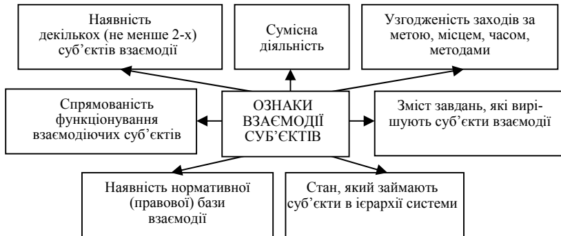
Рис. 1. Характерні ознаки процесу взаємодії суб'єктів, на думку А. Р. Лещух

Сутність поняття «взаємодія» як філософської категорії полягає у відображенні процесів впливу різних об'єктів один на одного, їх взаємної обумовленості та зміни стану або взаємопереходу, а також породження одним об'єктом іншого. «Взаємодія» тісно пов'язана з поняттям «взаємозв'язок» і розглядається як одна з форм останнього [1]. На думку О. М. Василюєва, «взаємодія полягає у певній організаційній діяльності як шляху до мети на основі узгодженості дій суб'єктів, а на організаційному етапі взаємодії здійснюються: нормативно-правове забезпечення взаємодії; реалізація нормативно-правового забезпечення – як приклад, створення координаційних центрів; безпосереднє планування заходів по взаємодії» [2]. Отже, в контексті забезпечення економічної безпеки держави взаємодія органів державної влади, компетентних у сфері реалізації функцій держави в економічній сфері, полягає у врегульованій нормами права організованій, скоординованій та спланованій системі заходів щодо реалізації та захисту національних інтересів держави в економічній сфері від реальних і потенційних загроз. У своїй праці «Теоретичні аспекти взаємодії органів місцевого самоврядування з іншими суб'єктами профілактики адміністративних правопорушень» [1] А. Р. Лещух до основних ознак процесу взаємодії суб'єктів пропонує віднести такі (рис. 1):