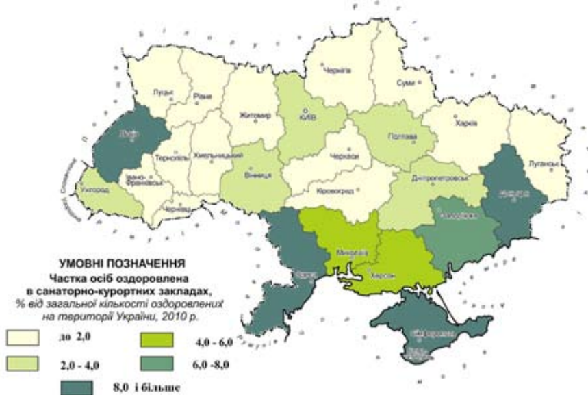
Рис. 2. Санаторно-курортні заклади України.

дохідної частини бюджету: за результатами 2011 р. дохід району перевищує видаткову частину на 2255 тис. грн. (шостий показник з-поміж адміністративних одиниць області) [9, с. 29]. Аналогічна картина спостерігається й в інших туристичних й рекреаційно-оздоровчих центрах області — м. Моршин, м. Трускавець, за винятком м. Львова, де по-сьогодні туризм відіграє другорядну роль у формуванні наповнення бюджету.