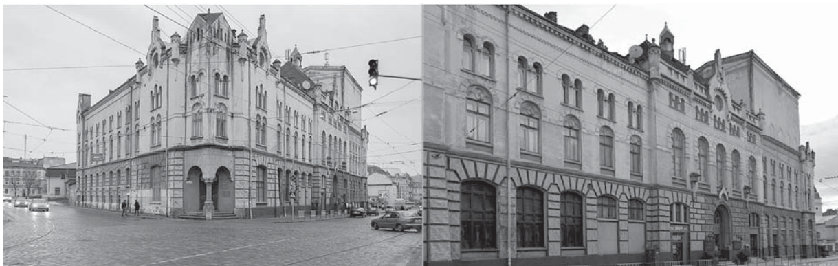
Рис. 1. Львівський драматичний театр імені Лесі Українки

Західні регіони України, як і вся наша держава, у різні часи перебували під владою різних народів, а відповідно під впливом різних культур. З цих причин культурно-мистецький розвиток відбувався на перетині різних культур, вбирав яскраві барви запозичень, створював власну синергію. Для прикладу, серед львівських театральних споруд цікавим прикладом багатогранності та практичності є приміщення Львівського драматичного театру імені Лесі Українки (рис. 1).