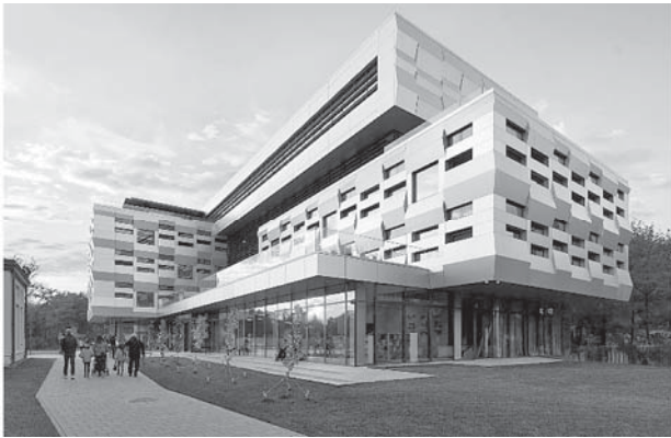
Рис. 3. Центр Митрополита Андрія Шептицького в Українському католицькому університеті у Львові. Загальний вигляд [13]

Тому, щоб передбачити розвиток сучасних культурних центрів, визначити їх оптимальну функціональну структуру та об'ємно-просторове рішення, необхідно аналізувати та використовувати архітектурний досвід, особливо кінця XIX – початку XX століть, часу, коли громадські будівлі стають найпопулярнішими як на наших теренах, так і в усьому світі.