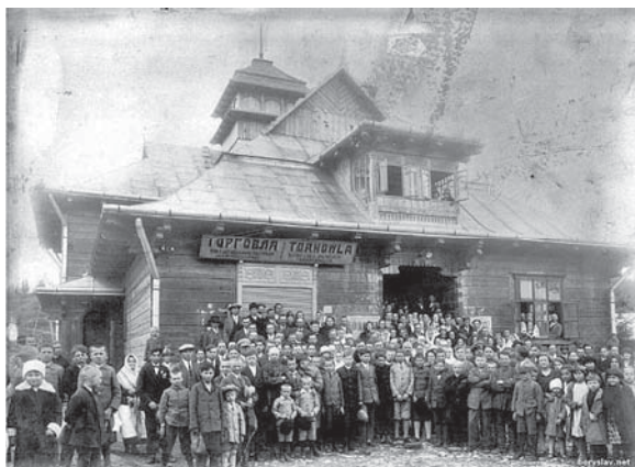
Рис. 1. Народний дім “Провіта” с. Мразниця. Загальний вигляд [11]

Аналізуючи передвоєнні культурно-просвітницькі будівлі, можна помітити, що сільські та міські клуби часто істотно відрізнялися за образним та архітектурно-просторовим вирішенням. Прообразами українських клубів у селах можна вважати традиційну українську хату, а також церкву (народні доми в Кальнім, Буцневі, Турці, Ворохті). Основні приміщення: читальня, гурткові кімнати, зала зібрань, недільна школа, торгівля. Міські ж переважно взорувалися на європейські зразки (народні доми у Львові, Чернівцях, Стрию, Перемишлі), а до базових функцій – читальні з бібліотекою, гуртків, зали зібрань, освітніх та торгових просторів – додалися театральна, офісна (приміщення спілок та товариств) та спортивна.