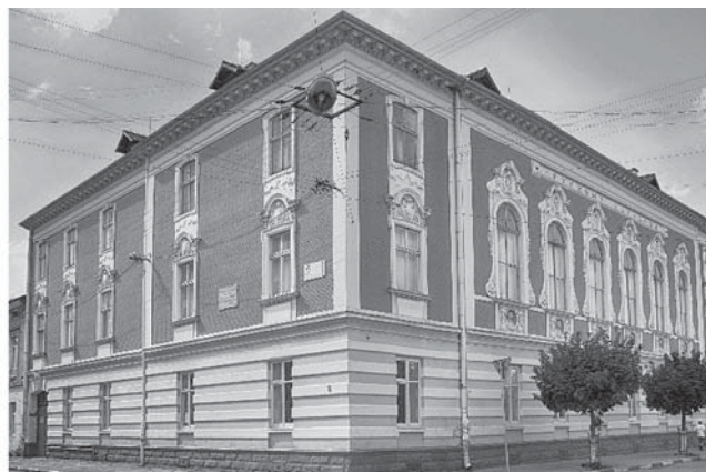
Рис. 2. Народний дім м. Стрий. Загальний вигляд [12]

З приходом радянської влади змінилися підходи до організації функціонування українських клубів, які були демократичними та загальнодоступними, а саме відбулася їх професійна орієнтація за прикладом “англійського клубу”: з’явилися будинки офіцерів, піонерів тощо. Вони містилися як у старих будівлях (будинок офіцерів у Львові – у просторах Народного дому), так і у спеціально збудованих (Палац культури і техніки заводу ЛОРТА у Львові, 1982 р.).