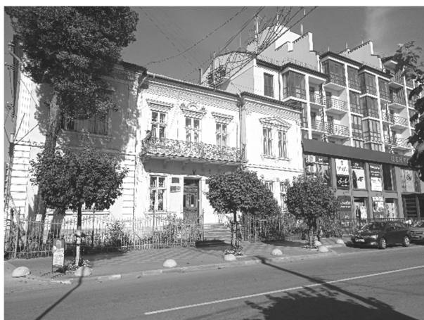
Рис. 5. Приклад просторової інвазії в історичному архітектурному середовищі.

наприклад, є збережені тримачі для вазонів, як рядових, так і окремих горщиків. На балконну частину виходить композиція з двох дерев'яних вікон (повністю збережених у всій будівлі) та дверей, над якими – сандрики з фризною та карнизною частинами. Фризи над вікнами другого рівня оточені кронштейнами. Також над карнизною частиною дверей збереглися декоративні вази-амфори. Вікна в ризалітах є об'єднані в пари та декоровані на другому поверсі трикутним сандриком. Добре збережений головний вхід із дерев'яними дверима, які відображають у своєму композиційному вирішенні декоровані елементи імпосту, профілів, тафель та притворної планки, та сходовою частиною із кованими перилами. Варто відзначити, що є ряд проблем із замоканням фасаду, пошкодженою карнизною частиною та з архітектурними елементами на боковому фасаді. Вищезазначений аналіз підтверджує, що будівля є дуже важливим елементом ансамблю центральної вулиці. І тут не можна не дослідити та не показати просторової інвазії, яка відбулася на сусідніх ділянках, адже на сьогодні пам'ятка оббудована висотною забудовою, яка не відповідає оточенню (див. рис. 5). Таке втручання в історичну забудову погано впливає на пам'ятки та на їх сприйняття. Важливо запобігти таким безвідповідальним інвазіям сучасних споруд в історичну забудову Стрия.