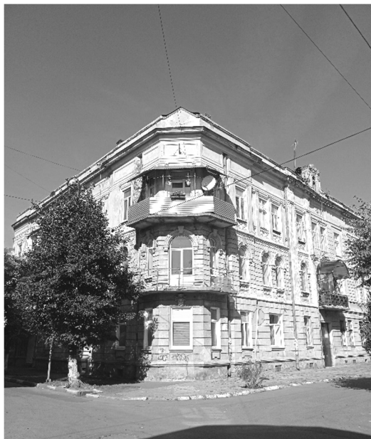
Рис. 4. Зображення сучасного стану будинку Мойше Геіселькорна, 2022 р.