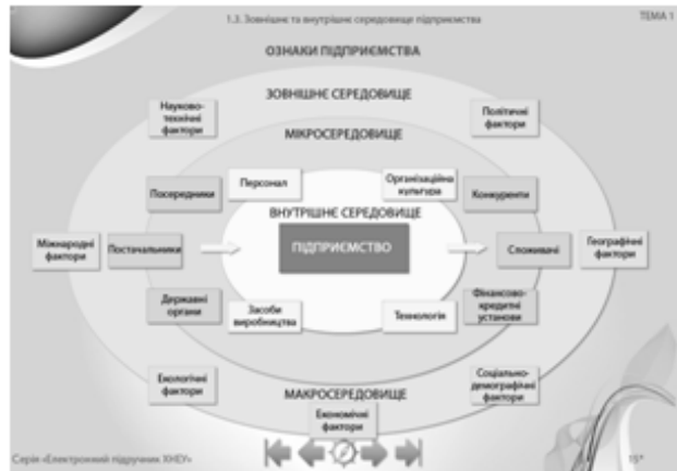
Рис. 2. Головна сторінка теми, сторінки теми за першою та другою методикою викладання