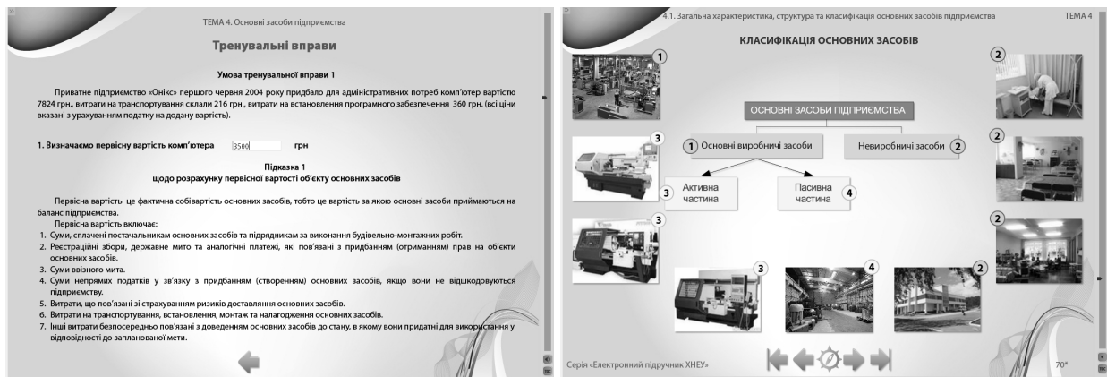
Рис. 4. Сторінка інтерактивної тренувальної вправи за темою, сторінка варіанта теми в схемах, що анімовані, із звуковим поясненням