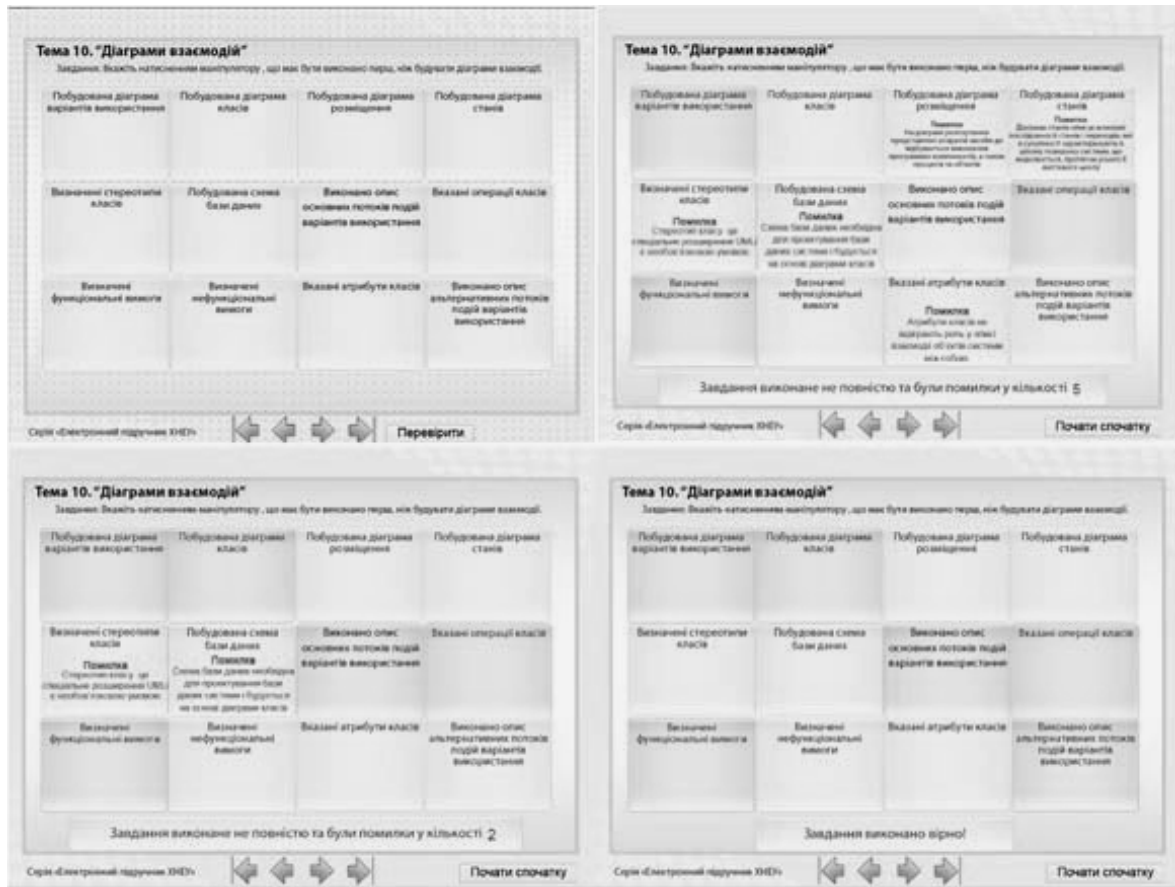
Рис. 3. Приклад тренувальної вправи з вибором областей маніпулятором, можливістю коригування під час повторного виконання

На рис. 3 показано вправу з поясненнями помилок та можливістю коригування під час повторного проходження для зменшення кількості помилок та успішного виконання завдання.