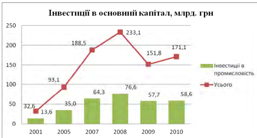
Рис. 1 а. Динаміка обсягів інвестицій в основний капітал України за 2001–2010 рр.

Динаміку обсягів інвестицій в основний капітал України, обсяг виконаних наукових та науково-технічних робіт та обсяг реалізованої інноваційної продукції наведено на рис. 1 (а,б):