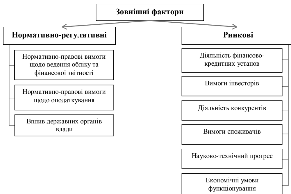
Рис. 2. Зовнішні фактори, які впливають на побудову системи контролінгу

Зовнішні фактори впливу на побудову системи контролінгу доцільно розглядати, виділивши дві групи: ринкові та законодавчо-регулятивні (рис. 2).