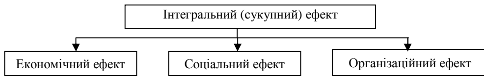
Рис. 1. Складові інтегрального ефекту від соціально-орієнтованого управління підприємством

представити інтегральну величину, що характеризує сукупність економічного, соціального і організаційного ефектів (рис. 1).