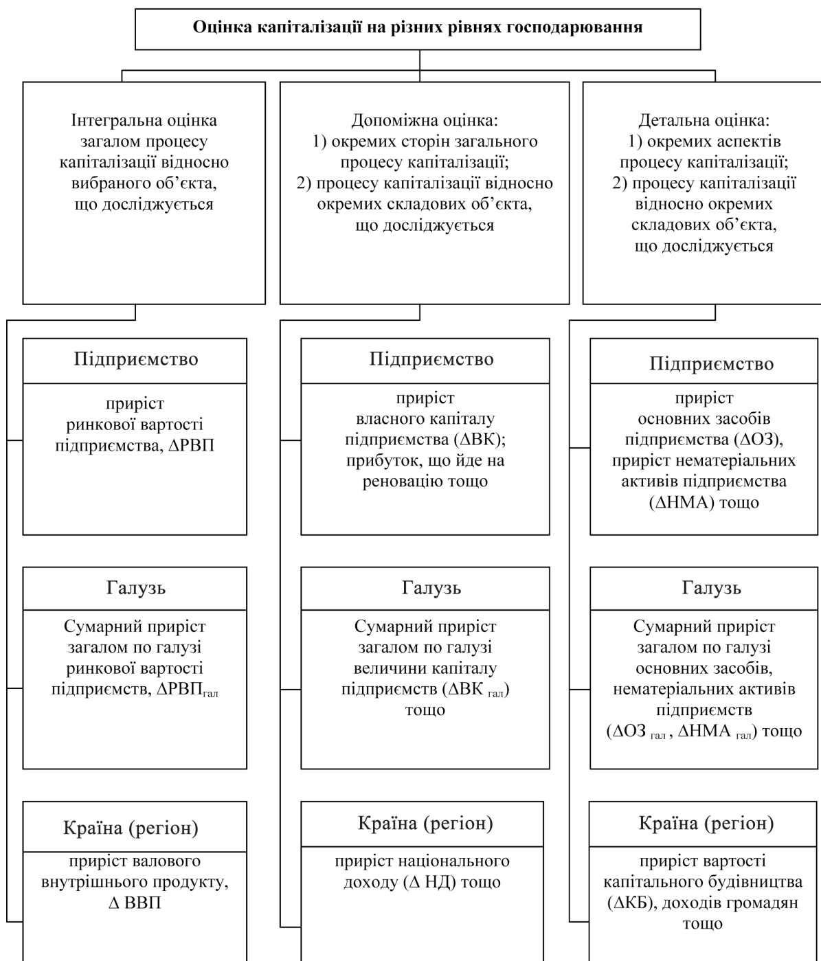
Рис. 2. Методико-прикладні підходи до оцінки процесу капіталізації на різних рівнях господарювання

Близьким до цього визначення є також визначення поняття “капіталізація регіону”.