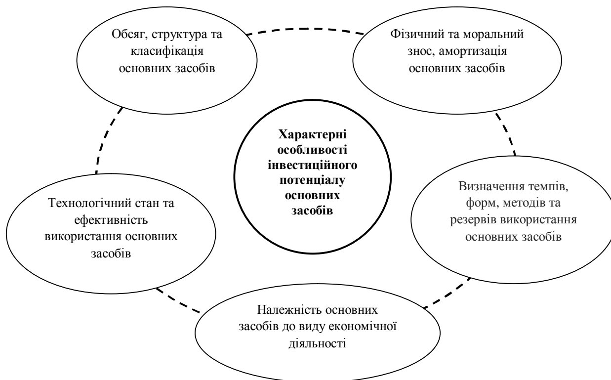
Рис. 2. Характерні особливості інвестиційного потенціалу основних засобів Складено авторами на підставі [19–23].

На рис. 2 подано інформацію про характерні особливості інвестиційного потенціалу основних засобів.