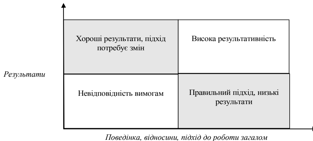
Рис. 1. Матриця результативності персоналу

У практиці зарубіжного менеджменту набув поширення матричний чи графічний метод оцінювання результативності працівників. Лінійний менеджер і працівник, що атестується, спільно вирішують, де перебуває останній у матриці або сітці результативності, зображеній на рис. 1.