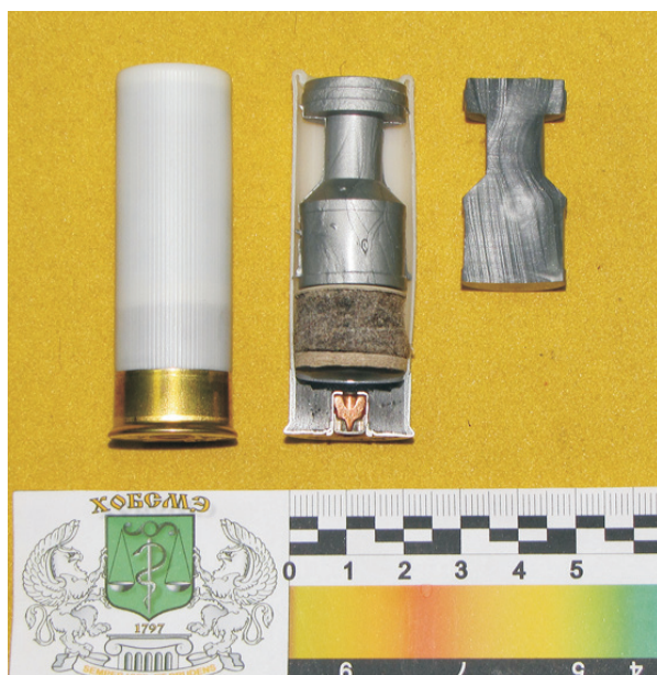
Рис. 1. Загальний вигляд патрону 12-го калібру «Терен-12П» та кулі, якою він споряджений

зультатів натурних випробувань. Судово-медична діагностика ушкоджень тіла та пошкоджень одягу, спричинених еластичними кулями патронів калібру 9 мм, виготовлених на підприємствах різних фірм-виробників в Україні, достатньо широко висвітлена у роботах вітчизняних фахівців з судової медицини [2-5]. Проте в судовій медицині та судовій балістиці на сталих методологічних засадах не опрацьовано комплексу науково-обґрунтованих діагностичних критеріїв, які б дозволили об'єктивно встановити як «вогнепальний» характер спричиненого пошкодження одягу, так і визначити саме уражаючий елемент, що його спричинив.