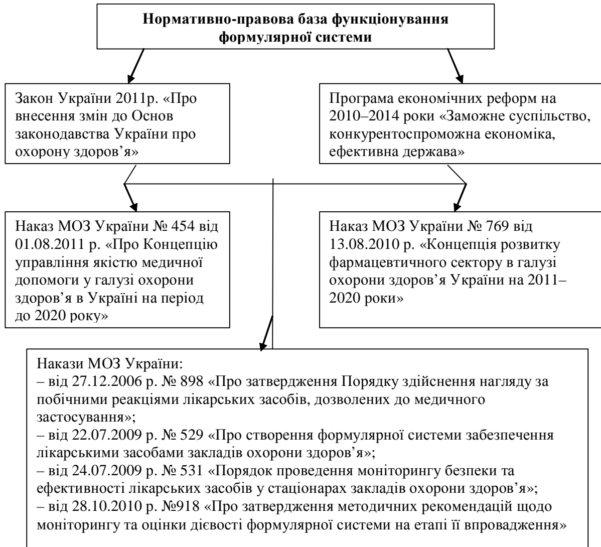
Рис. 2. Нормативно-правова база функціонування формулярної системи

поненти на рівні МОЗ України забезпечуються за рахунок ДП «Державний експертний центр» МОЗ України, на регіональному рівні – за рахунок МОЗ АР Крим, управлінь охорони здоров'я обласних та Київської, Севастопольської міських державних адміністрацій, а на місцевому рівні – за рахунок закладів охорони здоров'я.