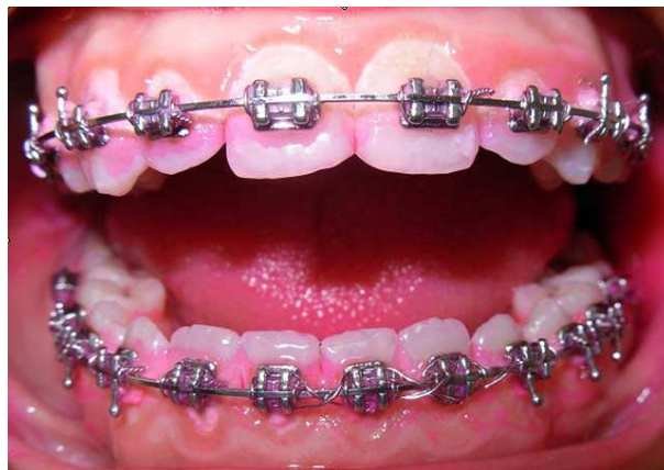
Рис. 2. Вид полости рта пациента 2 группы при определении ГСПР.

В дальнейшем пациентам обеих групп проводили ВАМО зубов и НОТ с использованием хендибластера «Prophy Jet» (рис. 3), в качестве абразива был использован порошок бикарбоната натрия ( \varnothing 0,63 \mu ).