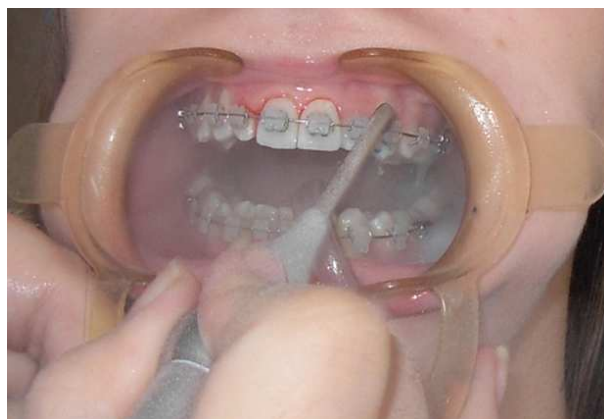
Рис. 3. Проведение ВАМО с использованием хендибластера «Prophy Jet».

При этом пациентам группы контроля проводилась тотальная ВАМО вестибулярной, оральной, аппроксимальных и окклюзионных поверхностей всех зубов верхней и нижней челюсти (табл. 1).