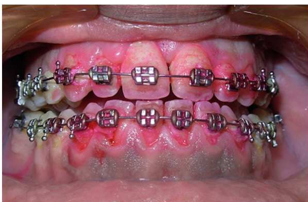
Рис. 1. Вид полости рта пациента 1 группы при определении ГСПР.

Исследование проводилось в УСЦ Харьковского национального медицинского университета на 24 студентах-добровольцах обоих полов в возрасте от 19 до 23 лет, находящихся на лечении НОТ. Исследуемые были разделены поровну на 2 группы.