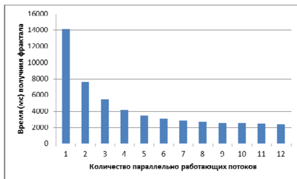
Рис. 3. Гистограмма времен получения фракталов в зависимости от количества используемых рабочих потоков

Для большей наглядности на рис. 3 данные табл. 1 представлены в виде гистограммы.