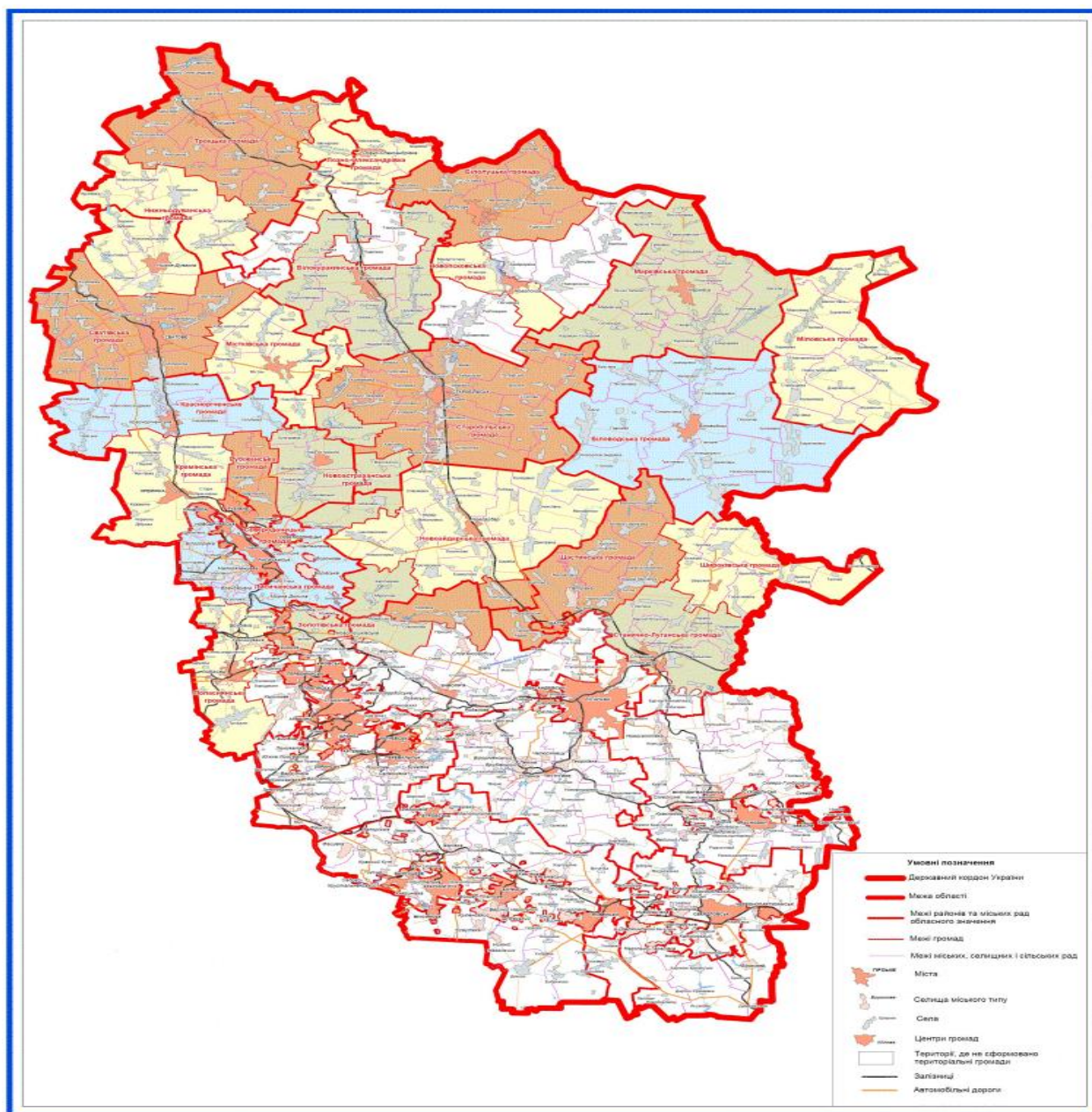
Рис. 2. Перспективний план створення ОТГ в Луганській області

На запитання щодо поліпшення кількості та якості комунальних послуг у зв'язку зі створенням ОТГ також більшість респондентів (68%) відповіли, що кількість та якість комунальних послуг у зв'язку зі створенням ОТГ підвищуються. Це проявляється у підвищенні рівня благоустрою населених пунктів громади завдяки ремонту покрівель, доріг (тротуарів), ліній освітлення, системи водозабезпечення, видаленню сухих дерев, вивезенню сміття (особливо з приватного сектору), встановленню спортивно-ігрових майданчиків, функціонуванню НЦАПів, забезпеченню пасажироперевезень, тощо.