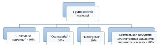
Рис. 3. Умовний розподіл клієнтів за рівнем лояльності до вантажоперевізників

Умовний розподіл клієнтів за рівнем лояльності до вантажоперевізників, зображений на рис. 3.