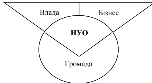
Рисунок 1 – Місце неурядових організацій у суспільстві [авторська розробка]

Бізнес, або комерційний сектор, включає фізичних осіб-підприємців, підприємства, фірми, господарські товариства та інших юридичних осіб.