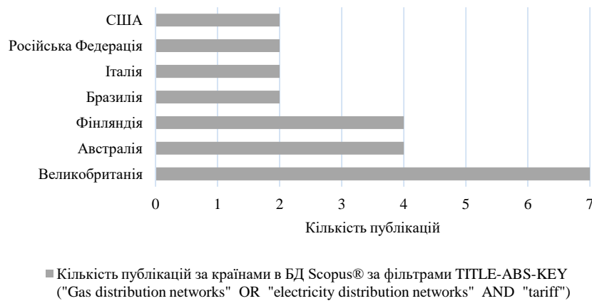
Рисунок 2 – Кількість публікацій за країнами в БД Scopus® за фільтрами TITLE-ABS-KEY "Gas distribution networks" OR "electricity distribution networks" AND "tariff"

Найбільша кількість публікацій була видана науковцями з Великобританії (рис. 2). І дещо менше публікацій створили за цією тематикою дослідники з Австралії та Фінляндії: по чотири публікації.