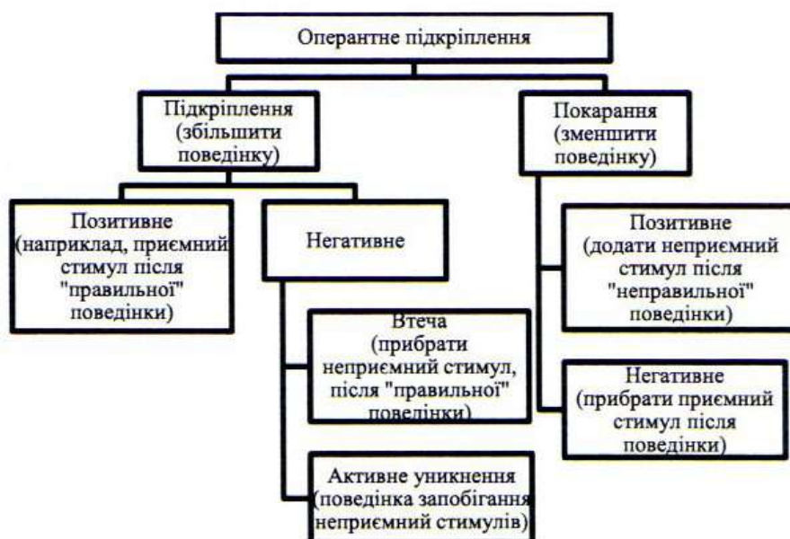
Рисунок 3 – Схема підкріплення в оперантній поведінці

Що стосується винагород, то відповідно до класифікації, яка наведена вище, на рисунку 3, виділяють позитивне та негативне підкріплення.