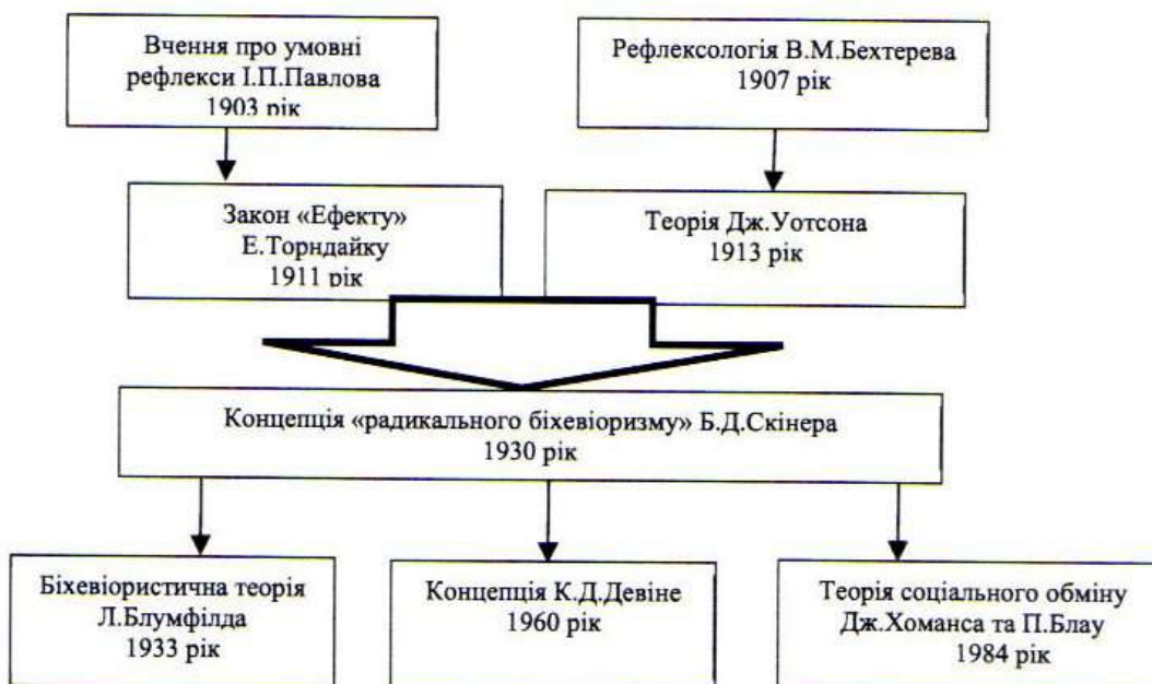
Рисунок 1 – Еволюція формування поведінкової доктрини та їх представники

Більш детальну характеристику представників теорій поведінкової доктрини надамо на рисунку 1.