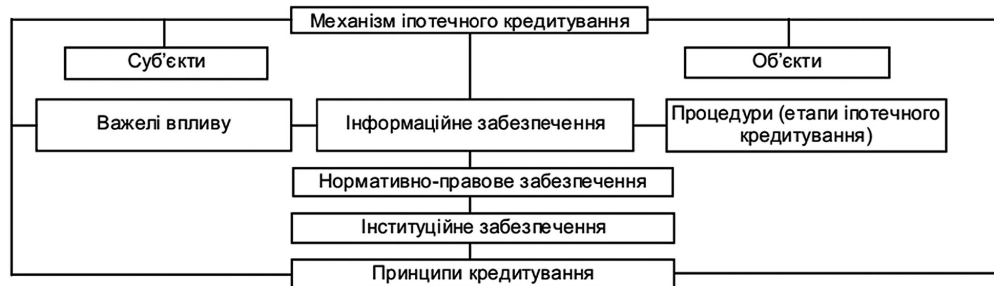
Рис. 1. Структура механізму іпотечного кредитування

носини з майбутніми власниками. При цьому власник здійснює виплати за кредитом підрядникові, а підрядник здійснює погашення іпотечного кредиту з одержаної суми за вирахуванням своєї норми прибутку. Цей спосіб більш вигідний для підрядника, оскільки він у праві скорочувати терміни надання кредитів власникам, що дає можливість підрядникові формувати вільні грошові кошти і використовувати їх у своїй діяльності [6]. Що стосується безпосередньо іпотечного кредитування, то воно належить до частини відносин, яка тісно пов'язана з використанням форми зниження ризику неповернення кредитів за допомогою застави саме нерухомого майна, включаючи цілісний майновий комплекс, землі. Структура механізму іпотечного кредитування включає такі основні елементи: суб'єкти, об'єкти, процедури кредитування, важелі (стимули, санкції), нормативно-правове забезпечення, інституційне забезпечення, інформаційне забезпечення. Ці складові та їхні характеристики визначаються рівнем розвитку економіки країни [1]. Зв'язок між зазначеними елементами представимо схематично (рис. 1).