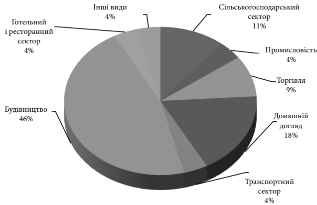
Рис. 1. Основні сфери працевлаштування українських трудових мігрантів (2010–2012 рр.) [5]

соціальних досліджень у рамках проекту, фінансового ЄС та впроваджуваного МОП і МОМ [5]. Україна за той термін втратила можливість приросту валового внутрішнього прибутку, оскільки щоквартально близько 120 тис. українських мігрантів шукали роботу за кордоном або виробляли ВВП для інших країн.