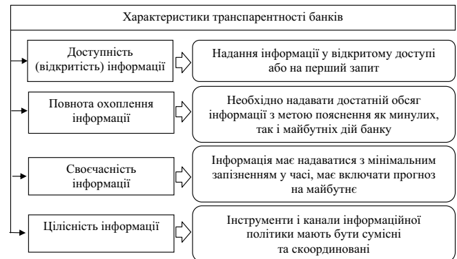
Рис. 1. Характеристики транспарентності банків

Виклад основного матеріалу. У контексті нашого дослідження, відповідно до позиції фахівців НБУ, під транспарентністю слід розуміти розкриття банками всіма зацікавленими особами інформації, що прямо чи опосередковано пов'язана з цілями діяльності банку, а також правовими, інституційними й економічними основами його функціонування в повному обсязі, своєчасно і в доступній формі [8]. Науковці виділяють чотири характеристики транспарентності банків (рис. 1).