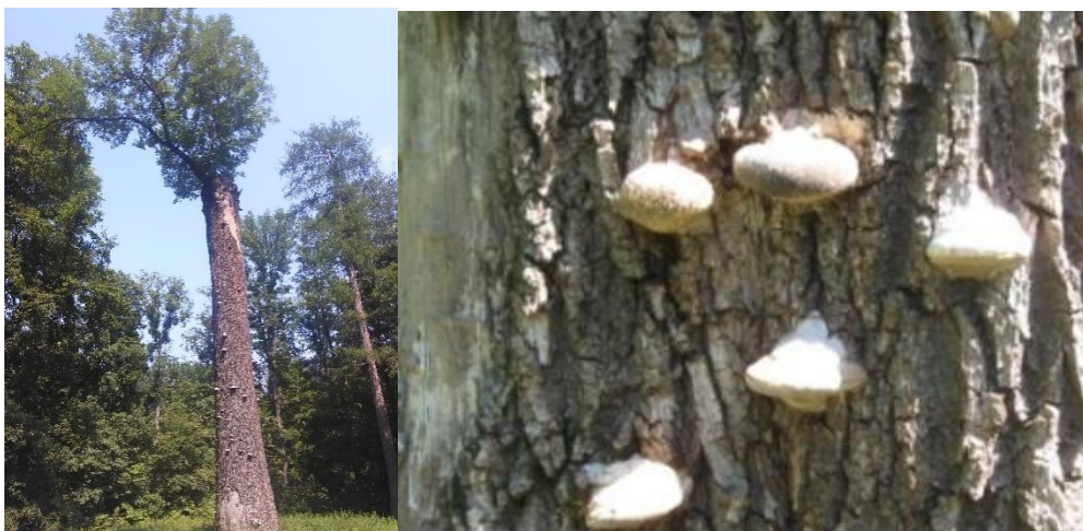
Рис. 3. Плодові тіла дереворуйнуючих грибів на Імператорському ясені

У середньовікових і старовікових дерев поширена така патологія, як морозобійні трі- щини. На старовікових деревах ясена звичайного виявлені чисельні патології. Крім вже означених морозобійних тріщин, майже всі старі дерева були уражені плодовими тілами трутовиків. В основному це був справжній трутовик Foraes fomentarius (L.) Gill. Він роз- міщувався на обломах скелетних гілок або неподалік обломів на стовбурах. На окремих старовікових деревах ясена виявлені плодові тіла лускатого трутовика Poliporus squarnosus Hudr. et Fr. Відомо, що гриб уражує дерева старшої вікової групи і викликає центральну гниль, інколи уражує коріння. Зараження відбувається через морозобійні тріщини (Жура- влєв, 1962). У одного з "Імператорських" ясенів, який нині всихає (живою залишилася лише одна скелетна гілка), весь стовбур уражений десятками плодових тіл трутовика (рис. 3).