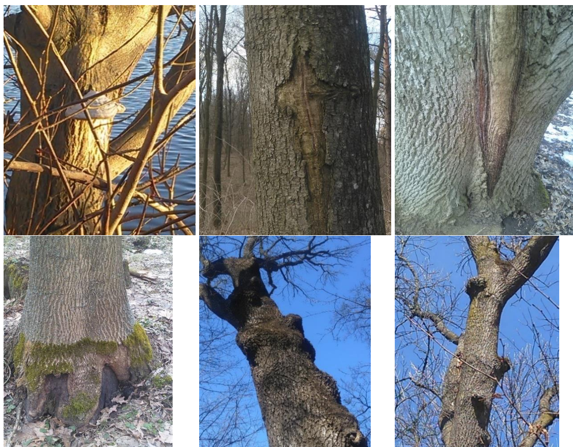
Рис. 7. Патологічні явища на деревах F. excelsior

Обстеження виявили в районі дослідження на F. excelsior різні патології (рис. 7) –