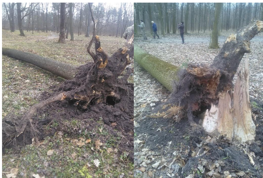
Рис. 4. Вітровал F. excelsior в епіцентрі ураження його халаровим некрозом

По мірі всихання ясенів в першому осередку, за останні 3 роки в ньому почав зростати механічний відпад – вітровал, в основному – середньовікових дерев. В літературі наводяться дані, що халаровий некроз йде в супроводі з корневими гнилями (Звягинцев, Сазонов, 2012). У поточному році відбувся вивал 14 середньовікових дерев південніше і на схід від осередку з ознаками корневих гнилей, що свідчить про наявність у дерев корневих гнилей. Під час сильних поривів вітру 10–11 березня 2019 року в південному і східному напрямках від осередку всихання відбувся вітровал 20 дерев ясена – 17 середньовікових, 2 пристигаючого віку і одного вікового (рис. 4).