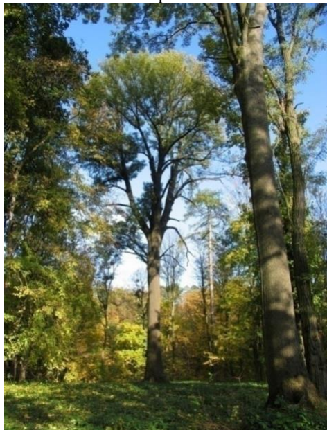
Рис. 1. Двохсотрічний "Імператорський" ясен в Царському саду

F. excelsior належить до основних ландшафтостворюючих порід і зростає майже на всіх ландшафтних ділянках дендропарку. В парку збереглося 25 екземплярів ясена віком біля 200 років. Серед них кілька екземплярів на Ясеневої алеї в східній частині парку, 4 екземпляри в Царському саду (рис. 1), висаджені членами імператорської сім'ї, 12 екз. виявлено в старовіковій діброві, як супутню породу дуба звичайного. Старовікові дерева ясена звичайного зростають в залишках двох алеї в північній та східній частинах парку.