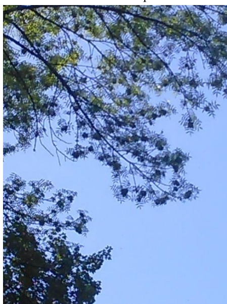
Рис. 5. Ураження генеративних органів F. excelsior туберкульозом ясена

Серед не гнилевих хвороб на деревах різних вікових груп відмічали ознаки ракових хвороб. Найчастіше на стовбурах та гілках утворювалися виразки та ракові рани.