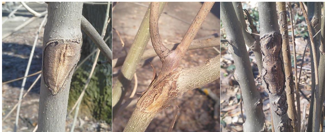
Рис. 6. Ознаки некротного ураження самосіву і порості F. excelsior

Паростеві деревостани F. excelsior характеризуються зниженою стійкістю до збудника туберкульозу (Мацях, Крамарець, 2014). На підрості і порості ясенів ми відмічали чисельні некротні ураження (рис. 6), які, за даними І.П. Мацяха, В.О. Крамарця (2014), свідчать про розвиток у рослин туберкульозу. Проте, враховуючи неспецифічність даних симптомів, без спеціальних досліджень ми не можемо стверджувати про той чи інший діагноз у даної вікової групи.