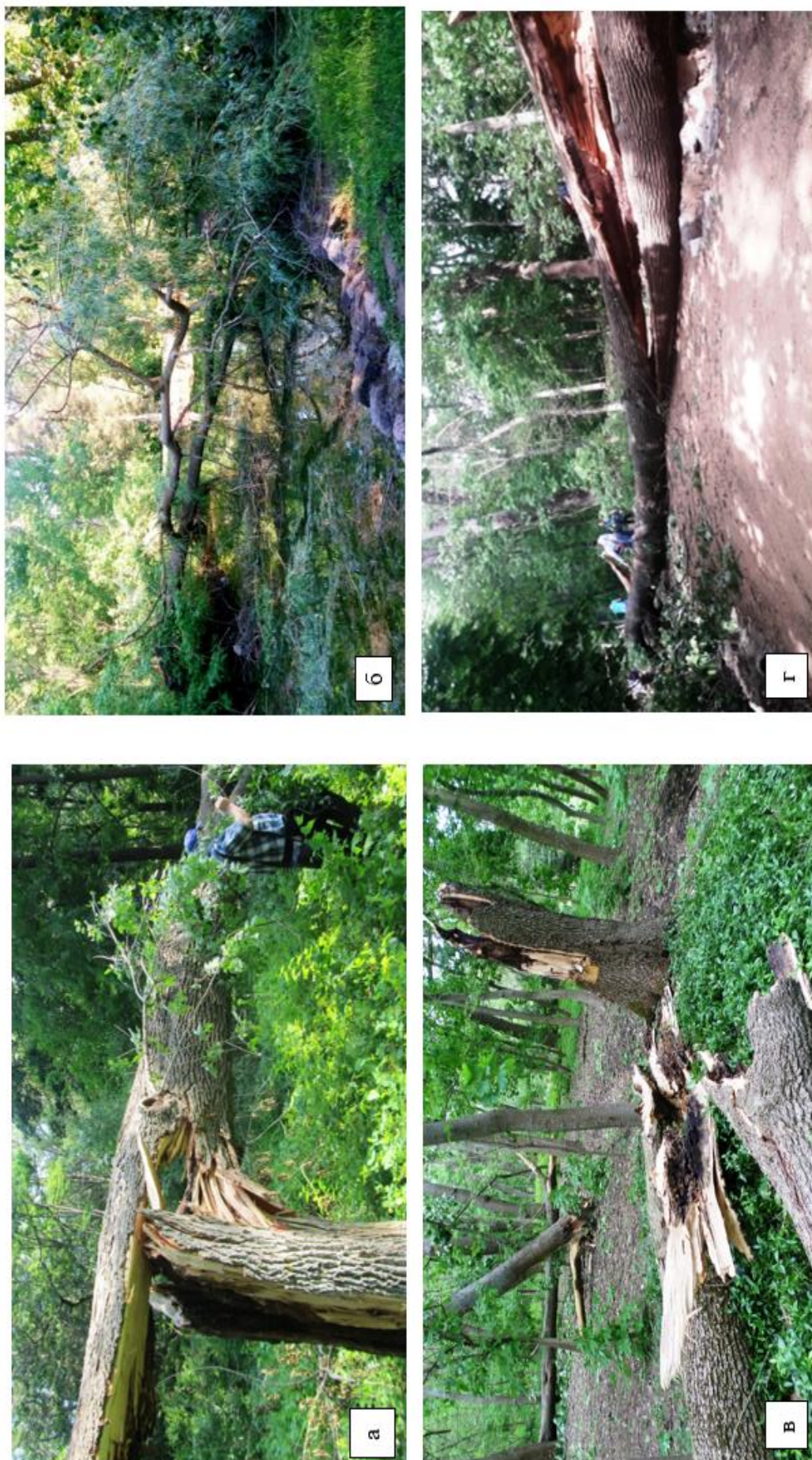
Рис. 3. Випади найбільш крупних дерев у старому парку: а – ясеня оксамитового в арборетумі; б – верби білої на острівці озера; в-г – ясеня звичайного в куртинах 40 і 58