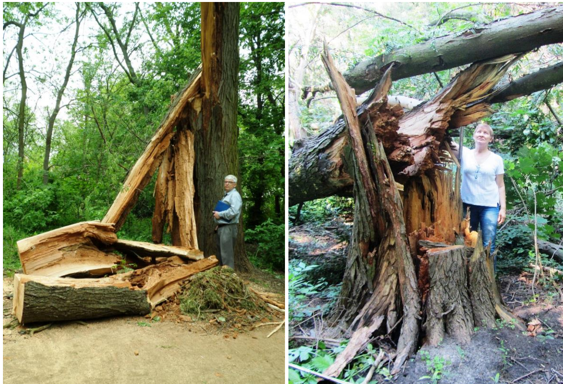
Рис. 2. Випалі найкрупніші особини гледичії колючої

Найзначніші випадки сталися в насадженнях старого парку (рис. 1). Вони торкнулися старих, а, отже, крупних дерев, переважно, ясеня звичайного та гледичії колючої. Практично всі вони мали ураження від біотичних (рідше – абіотичних) чинників, тому їх або вивертало з коренем, або розламувало, в залежності від локалізації пошкодження стовбуровими шкідниками, гнилями чи морозобоїнами, при основі чи на різній висоті стовбура (рис. 2, 3). Зламани при падінні інших дерев, за винятком чотирьох чималих особин ясеня звичайного, були здоровими молодими рослинами каркаса західного та клена гостролистого. Відзначимо, що буревієм знищено декілька з найкрупніших особин гледичії колючої, у т.ч. одну (діаметром стовбура 1 м), що росла в межах екскурсійного маршруту з часів заснування парку (рис. 2), та одне з двох колекційних дерев ясеня оксамитового, включеного до Червоного списку Міжнародного союзу охорони природи (далі – ЧС МСОП), в арборетумі.