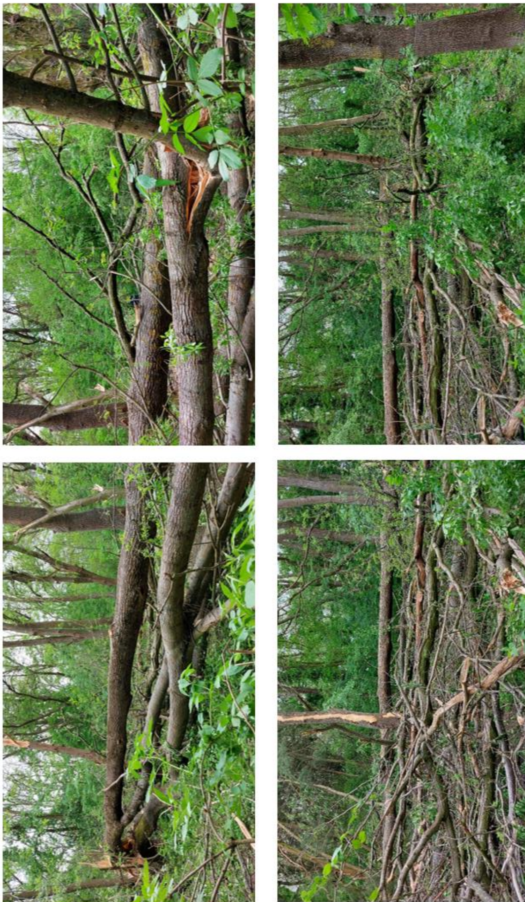
Рис. 4. Найбільше захарашення поваленими деревами у парку (курт. 63 гледичіевого рідколісся)