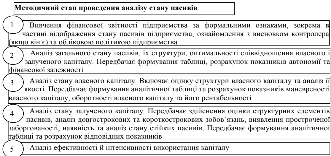
Рис. 3. Стадії методичного етапу аналізу стану пасивів

Другий етап проведення економічного аналізу стану пасивів – методологічний – передбачає формування найоптимальнішого і найефективнішого механізму проведення економічного аналізу стану пасивів, який по суті, характеризується виконанням завдань аналітиком у найбільш доцільній послідовності. Враховуючи пропозиції попередників, визначено стадії методичного етапу процесу економічного аналізу стану пасивів підприємства (рис. 3).