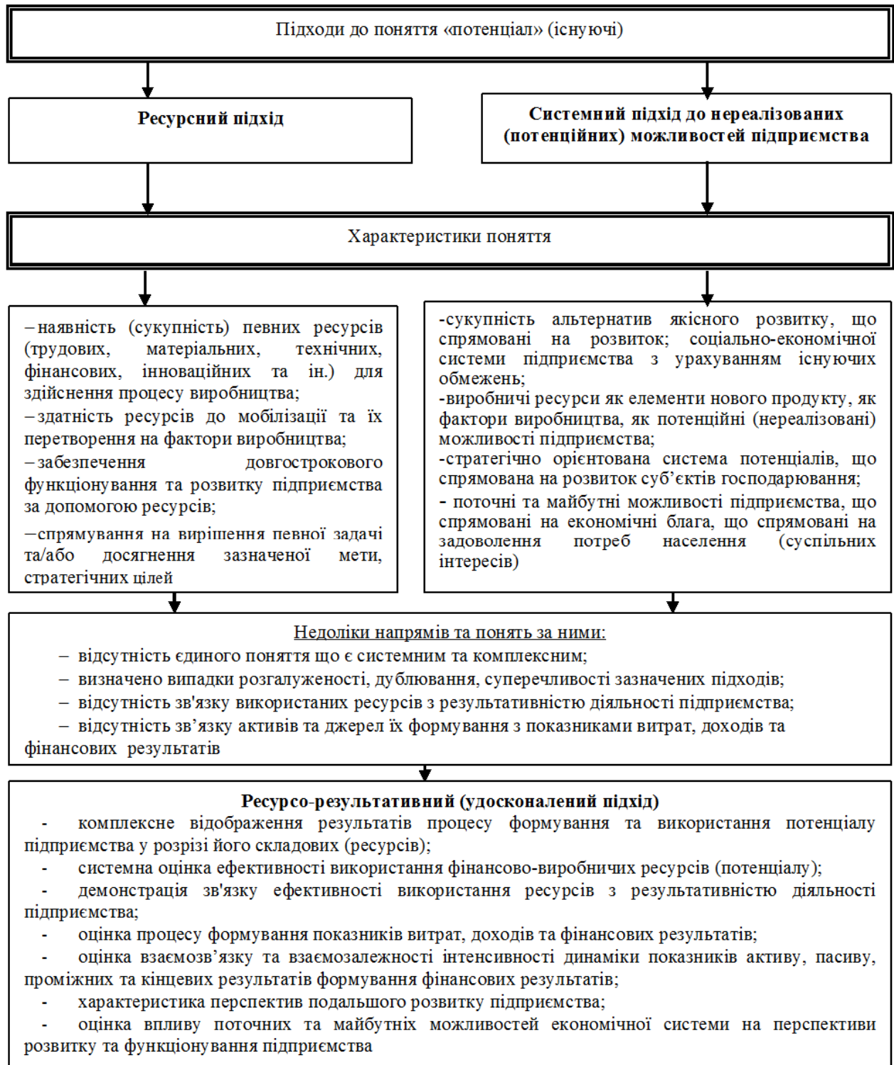
Рис. 1. Існуючі та удосконалені підходи до оцінки потенціалу підприємства та їх характеристики

Вертикальний аналіз для оцінки потенціалу використовується у процесі дослідження структури потенціалу (економічних ресурсів), шляхом розрахунку питомої ваги окремих елементів до загальної суми на певну дату. Горизонтальний аналіз зводиться до дослідження абсолютних зміни величин (складових потенціалу) та їх відхилення у відсотках за різними складовими економічних ресурсів, періоду, що аналізується. Порівняльний аналіз потенціалу зводиться до зіставлення складових потенціалу (економічних, фінансових ресурсів) із середньо-галузевими, з показниками передових підприємств, з показниками конкурентів, з базисними періодами, планом; з показниками на початок та кінець звітної періоду. Коефіцієнтний аналіз здійснюється шляхом дослідження рівня і динаміки відносних показників аналізу стану активів (потенціалу) та джерел його формування, які розраховуються за даними фінансової звітності і порівнюються з базовими даними.